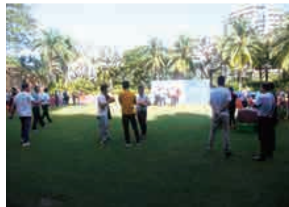
▲ 经销单位代表大会活动现场