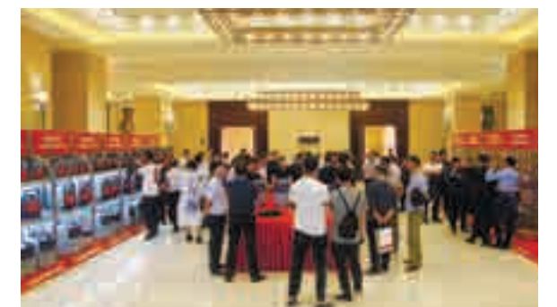
▲ 经销单位代表参观交流现场

2020年，集团将进一步完善管理和生产，优化渠道和政策，整合市场资源，坚定信心，敢于拼搏，群策群力，共筑梦想。（编辑部）