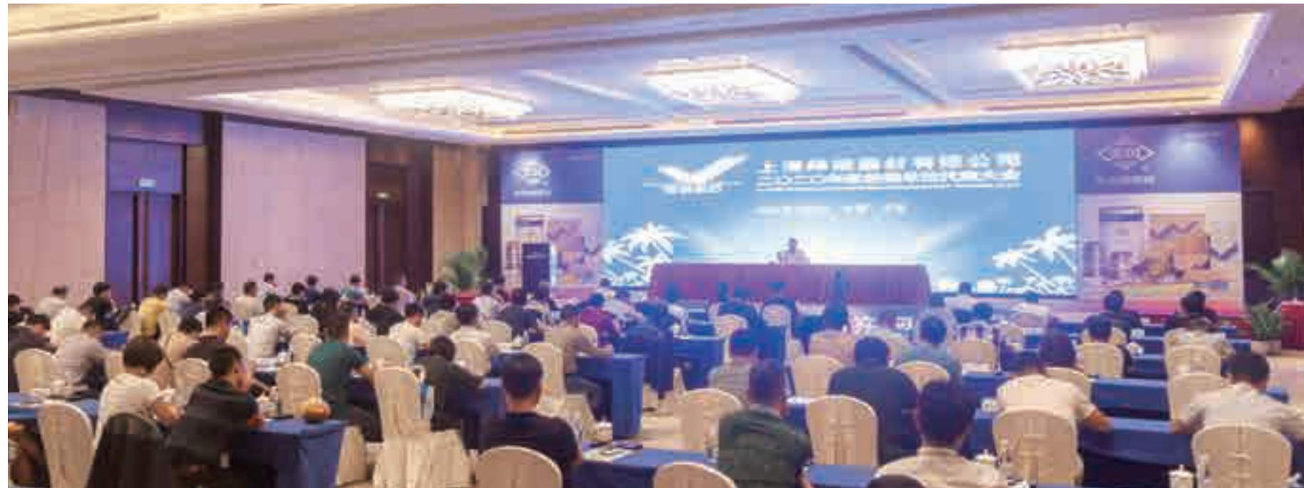
▲ 上海焊接器材二〇二〇年度经销单位代表大会现场