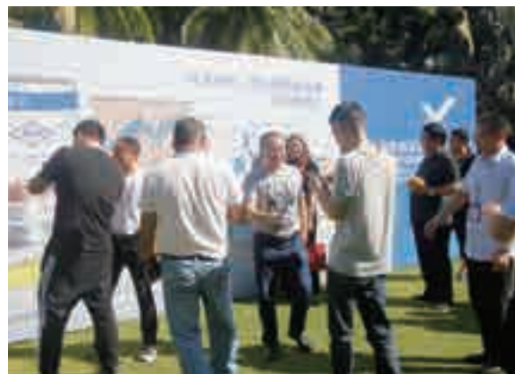
▲ 经销单位代表签名现场