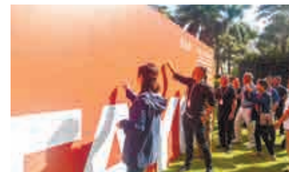
▲ 经销单位代表签名现场